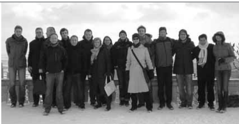
Teilnehmerinnen und Teilnehmer der 1. Transatlantischen Doktoranden-Akademie