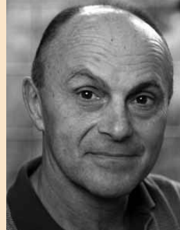
Eugene F. Fama

Die tiefere Ursache für diesen totalen Funktionsausfall lag, wie bereits angedeutet, in den Preiseinbrüchen auf den Vermögensmärkten. Insbesondere die Aktienmärkte weltweit, aber auch die Rohstoffmärkte, denen von fast allen „Experten“ nachhaltige Preissteigerungspotenziale attestiert wurden, brachen nicht nur massiv, sondern auch in atemberaubender Geschwindigkeit ein. So sank z.B. der Ölpreis (Brent Spot) von ca. 145 US-$ pro Barrel im August 2008 auf weniger als 36 US-$ pro Barrel zum Jahresende 2008. Der Silberpreis stürzte von fast 21 US-$ pro Feinunze im April 2008 auf 9 US-$ im November 2008 ab. Die Deutsche-Bank-Aktie notierte im Juni 2007 noch zu 120 €, im Dezember 2008 nur noch zu 19 €, die MAN-Aktie sackte von 124 € (im November 2007) auf 28 € (im Dezember 2008) und selbst die als extrem konservativ geltende BASF-Aktie schockte ihre Anleger durch einen Absturz binnen Jahresfrist von 52 € auf 18 €. Die ebenfalls im Premiumsegment DAX notierte Aktie der infineon AG schaffte zwischen August 2007 und Januar 2009 den Abstieg von 13,44 € auf 0,65 €. Dieser „Blue Chip“ hatte also innerhalb von eineinhalb Jahren gut 95% seines Wertes eingebüßt. Auf der Seite der Preissteigerungsexzesse kann wohl die VW-Aktie als Spitzenreiter