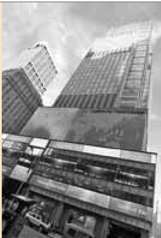
Hauptsitz von Lehman Brothers in New York