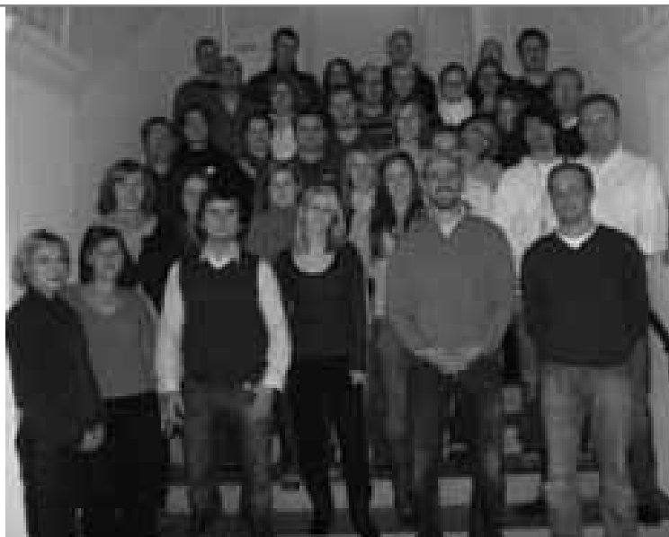
Teilnehmerinnen und Teilnehmer der 14. Herbstakademie des DNWE

ses auf internationaler Ebene überdeutlich. Zusammenfassend erklärte Wieland, dass Ethik – in welcher Form auch immer – tief in das Leben der Menschen und ihre Routinen eingreift. Letztlich geht es vor allem nicht darum, moralische Ziele zu kommunizieren, sondern die Prozesse, die zu deren Erreichung initiiert werden.