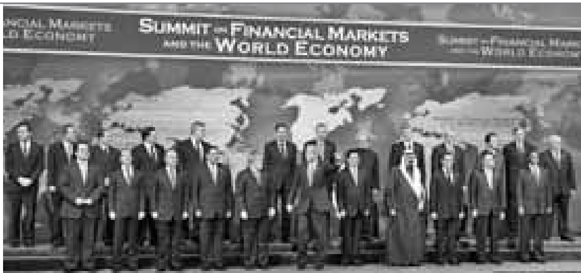
Weltfinanzgipfel, November 2008

gehalt der zu strukturierten Finanzprodukten umgestrickten Ursprungsrisiken und der sie tragenden Vehikel. Im Fokus stehen hier die „Prügelknaben“ der Finanzmarktkrise, die Rating-Agenturen, insbesondere im Bereich Anleiherating. Zu geringe Transparenz über ihre Vorgehensweisen, asymmetrisches Verhalten (Anleihen werden schneller hoch- als herabgestuft) und zu späte Reaktionen auf die verschärften Kreditrisikolagen lauten die allgemein bekannten Vorwürfe. Beim Weltfinanzgipfel im November 2008 standen diese Akteure noch stärker als in den vergangenen Jahren im Zentrum der Kritik. Sind nun die Analyse- und Ratingverfahren des Nachhaltigkeitsspektrums die überlegeneren Informationslieferanten und damit auch Krisenfrüherkennung? So besteht ja durchaus in internationalen Standesorganisationen der Kapitalmärkte wie der Enhanced Analytics Initiative die Vorstellung, dass man aus den Techniken der Nachhaltigkeitsratings auch für die konventionelle Aktien- und Anleiheanalyse dazu lernen könne.