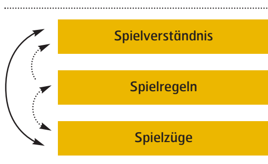
Abbildung 1: Schema Spielverständnis – Spielregeln – Spielzüge

lich ist es vielmehr, dieses Eigeninteresse einer Selbstbindungen aus Eigeninteresse zu unterwerfen. Zur Verdeutlichung dessen, was mit „Selbstbindung“ gemeint ist, nutzen wir das folgende Schema: