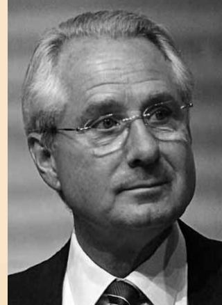
ehemaliger Post-Chef Klaus Zumwinkel

Die Globalisierung lässt uns den Begriff „Gesellschaft“ jedoch nicht nur national interpretieren, sondern zwingt uns, die Wirkung von Steueroasen auf alle betroffenen Bürger der Welt ins Kalkül zu ziehen. Besonders trifft es hierbei die Schwächsten: die eine Milliarde hungernder Menschen und die zwei weiteren Milliarden Menschen, die unterernährt sind. 25 Steueroasen ermöglichen den (illegalen) Kapitalabfluss aus den Entwicklungsländern in der eingangs genannten Größenordnung. Aufgeblähte Finanzvolumina verstärken zudem die Spekulation