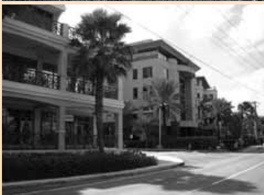
Steuerparadiese: Monaco (oben) und George Town, Cayman Islands (unten)

unbesteuerter („weiße“) Einkommen entstehen.