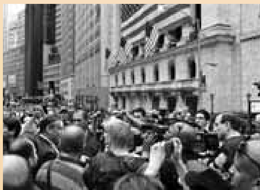
Presseaufgebot vor der New Yorker Börse im Herbst 2008