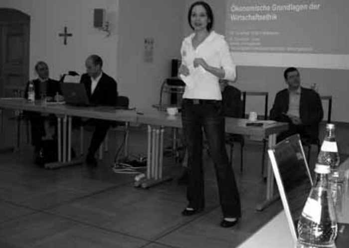
Gesprächsrunde (li.) und Orgelbesichtigung (re.) in Weingarten