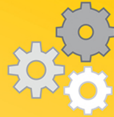
INTERNAL SUSTAINABLE OPERATIONS MANAGEMENT